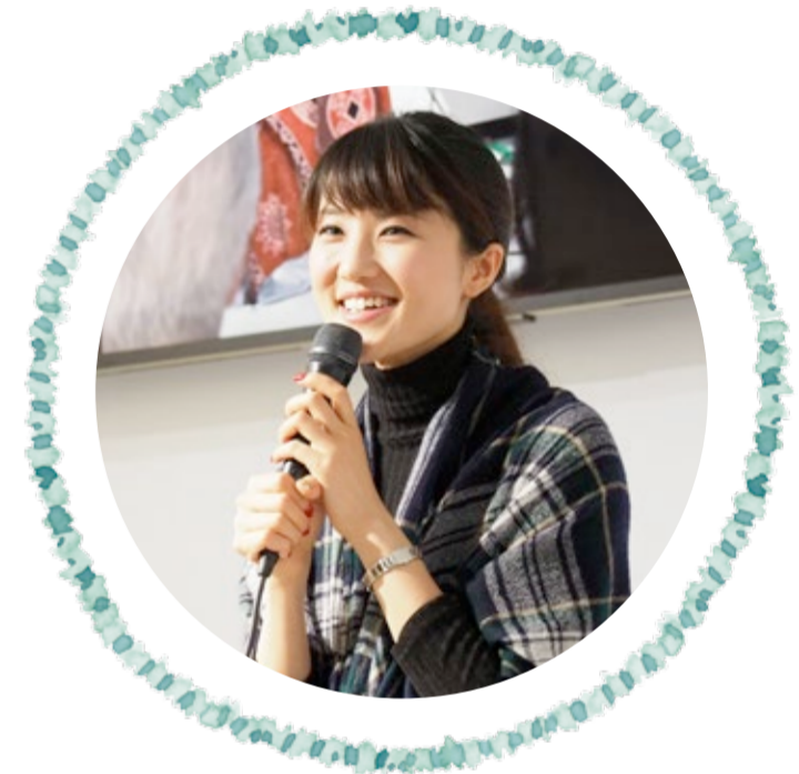
うた はるか 歌 陽香

大人の方も踊りだしたくなるような軽快なリズム。大きな口を開けて歌っている生き生きとした子供たちの表情が浮かぶ、そんな歌詞。今回の録音では、幼い頃の自分が歌う姿をイメージし、いつも以上に元気に笑顔での録音を心がけつつ、何よりも楽しく歌わせて頂きました。きっと先生方もニコニコ笑顔で歌えば、自然と口角が上がり、明るい声色で子供たちと楽しく歌っていただけると思います。